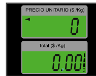
Pantallas de cuarzo con iluminación (backlight)