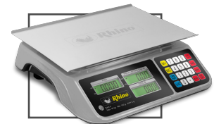
Incluye mica protectora