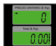
Pantallas de cuarzo con iluminación (backlight)