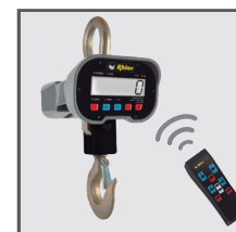
Opción de operación a distancia por control remoto

SERVICIO Y REFACCIONES DISPONIBLES Contamos con una red de centros de servicio en toda la república: rhino.mx/servicio.html