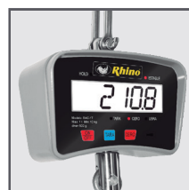
Pantalla de cuarzo líquido con iluminación